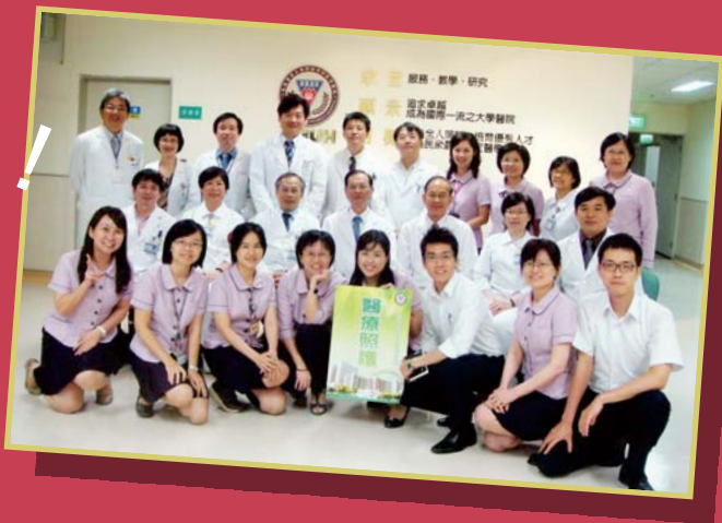
▲ 下一棧更幸福，評鑑